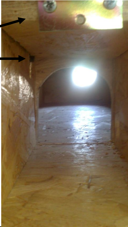
Montage der Mausefalle mit Loch für die Schnur, Mausefalle vorbohren,

Ansicht des Einganges, Schanier mit Klappe, Auslösestange,